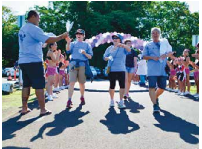
마치 오브 다임즈(March of Dimes, 소아마비 구제 모금 운동), 마치 포 베이비스 워크(March for Babies Walk), 힐로