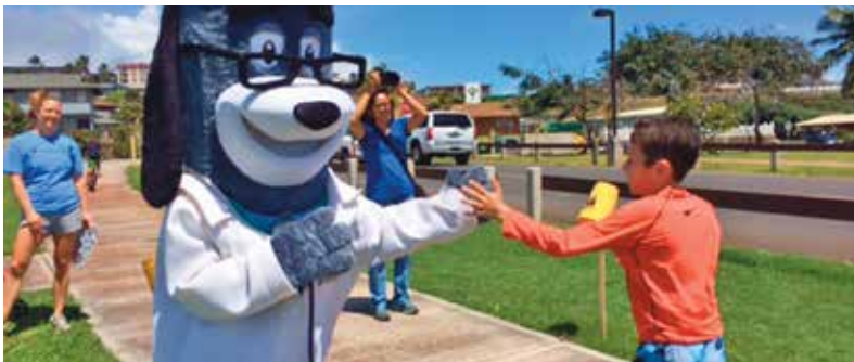
마우이 가족 YMCA 건강한 아동의 날 5K 및 장거리 달리기 대회(Maui Family YMCA Healthy Kids Day 5K and Fun Run), 카홀루이