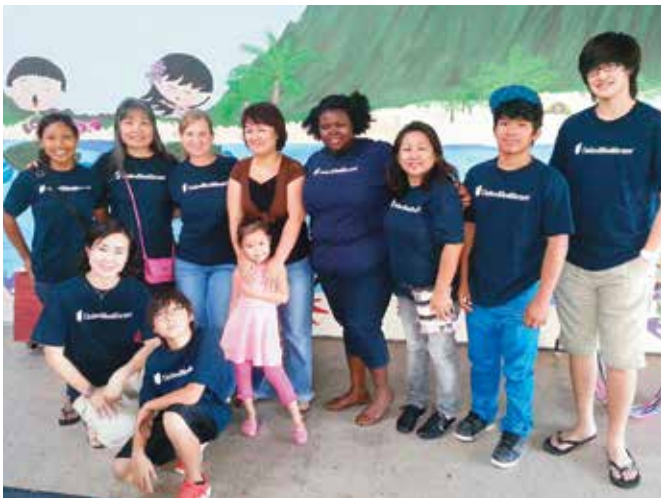
다음 단계 피난처 2월 케이크 생일 파티(Next Step Shelter February Keiki Birthday Party), 호놀룰루

우리는 또한 살고 일하는 지역사회에 자발적으로 기여합니다. 우리는 만나는 각 사람과의 유대감을 소중히 여깁니다. 최근에 우리가 지역사회 일원으로 단결했었던 몇 가지 행사를 생각해 보십시오.