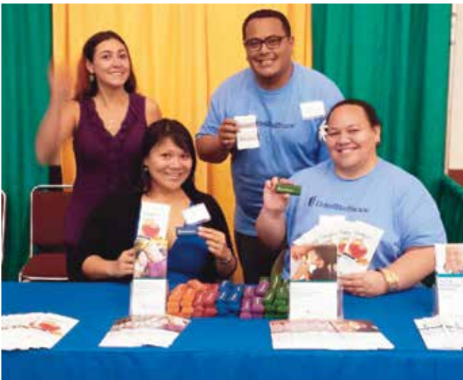
TCOYD 당뇨병 컨퍼런스 & 건강 박람회(TCOYD Diabetes Conference & Health Fair), 호놀룰루