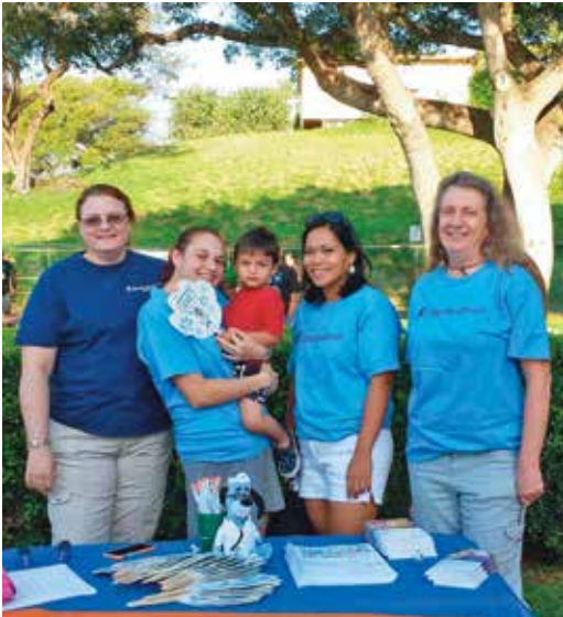
마치 오브 다임즈(March of Dimes, 소아마비 구제 모금 운동), 마치 포 베이비스 워크(March for Babies Walk), 카홀룰루