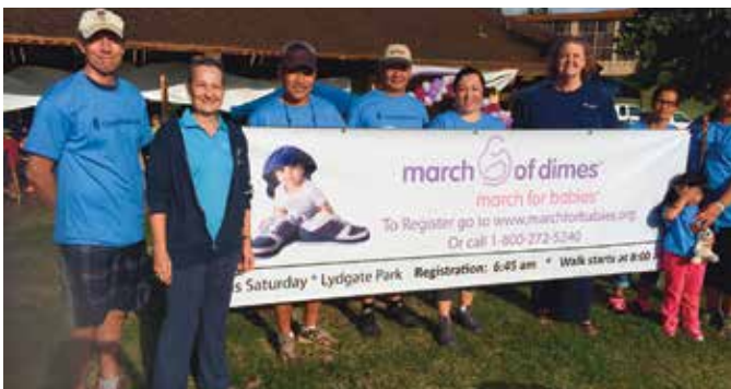
마치 오브 다임즈(March of Dimes, 소아마비 구제 모금 운동), 마치 포 베이비스 워크(March for Babies Walk), 카파아