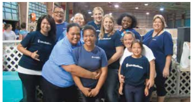
다음 단계 피난처 2월 케이크 생일 파티(Next Step Shelter February Keiki Birthday Party), 호놀룰루