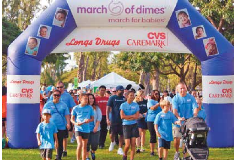
마치 오브 다임즈(March of Dimes, 소아마비 구제 모금 운동), 마치 포 베이비스 워크 (March for Babies Walk), 호놀룰루