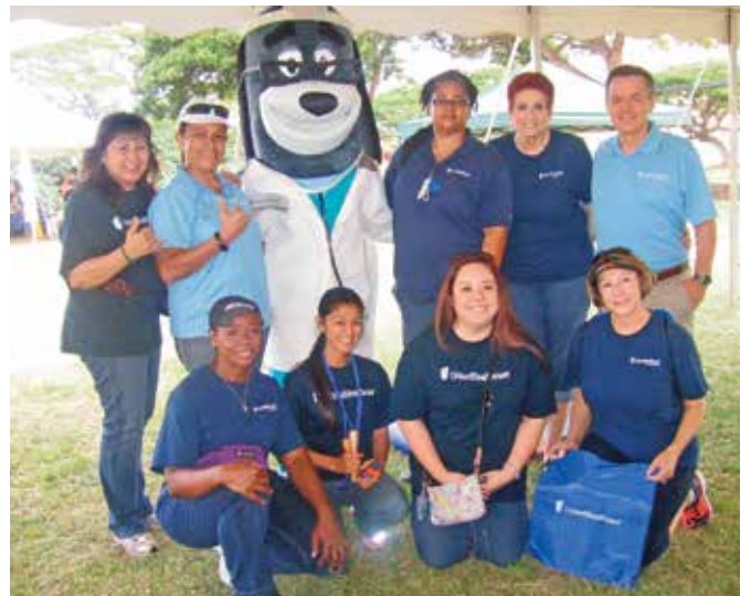
제 9회 연례 와이아나에 해안 케이크 봄 축제, 와이아나에