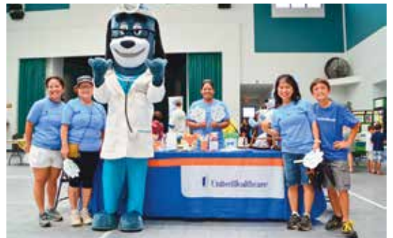
가족 잔치 / 소중한 아동 가족 행사 (Celebrate Your Family / Cherish the Child Family Event), 힐로